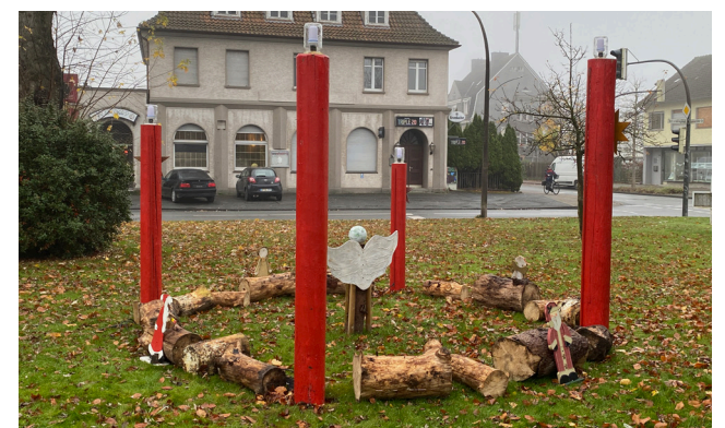
Kann wieder vor der Christuskirche bestaunt werden: Der große Adventskranz

Was für Dortmund der Riesen-Weihnachtsbaum ist, das ist in Ahlen der große Adventskranz vor der Christuskirche: Pünktlich zum 1. Advent vom Ehepaarkreis der Christuskirche aufgestellt, werden nach und nach die Kerzen leuchten und in „Mexiko“ für entsprechende Adventsstimmung sorgen. Erfunden wurde der Adventskranz übrigens von Pfarrer Johann Hinrich Wichern (1808-1881) im Jahr 1839. Um die Ungeduld der verarmten Kinder, die er in seinem „Rauhen Haus“ in Hamburg betreute, bis Weihnachten zu dämpfen, hängte er ein großes Wagenrad unter die Decke des Betsaals, auf dem vier große weiße und 20 kleine rote Kerzen befestigt waren. An jedem Tag wurde eine der Kerzen angezündet. Aus praktischen Gründen hat sich daraus der Kranz mit vier Kerzen entwickelt, der heutzutage nahezu in jedem Haushalt zu finden ist.