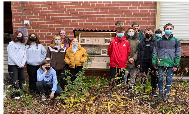
Bauten den Insekten ein komfortables Hotel: Konfirmanden der Christuskirche (Foto: privat).

Eine Gruppe von Konfirmanden und Konfirmandinnen der Christuskirche hat sich am 13. November einen ganzen Samstag lang Zeit genommen, um mit der sachkundigen Unterstützung der Naturschutzjugend Ahlen ein Insektenhotel zu bauen und damit einen Beitrag zur Förderung der Artenvielfalt und zur Bewahrung der Schöpfung zu leisten. Gleich im Anschluss wurde es im Staudenbeet vor dem Pauluszentrum aufgestellt. So bietet es nun zahlreichen Wildbienen und anderen Insekten nicht nur eine Unterkunft und Brutstätte, sondern gleich auch ein passendes Buffet, um nach dem Schlupf oder der Winterruhe neue Energie zu tanken. Unterstützt wurde das Projekt auch durch den Förderverein Umweltschutz und erneuerbare Energien in der Evangelischen Kirchengemeinde Ahlen, der die Materialkosten übernommen hat.