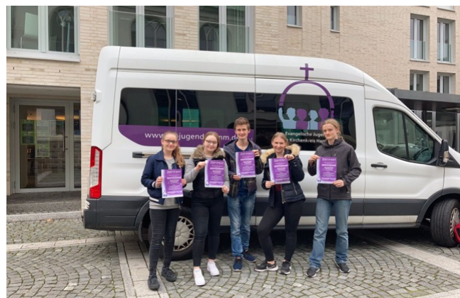
Fünf Jugendliche erwarben vor kurzem bei einer Schulung im Kirchenkreis die Jugendleiter-Karte.

Gleich fünf Mitglieder der Jugendgruppe der Evangelischen Kirchengemeinde Ahlen haben an der diesjährigen „JuLeiKa“-Schulung des Kirchenkreises Hamm teilgenommen und damit die Jugendleiter-Karte erworben. Die insgesamt sechstägige Schulung vermittelte grundlegendes Wissen als Basis für ein verantwortliches, ehrenamtliches Engagement in der Gemeinde: rechtliche Grundlagen, Organisationstechniken, aber auch Methoden, Spiele und gruppendynamisches Know-how wurden erlernt, um Kinder- und Jugendgruppen mitzugestalten oder zu leiten. Herzlichen Glückwunsch!